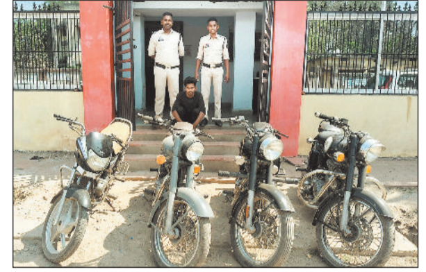
हरिभूमि न्यूज ►► रायगढ़

पुलिस ने कुछ ऐसे चोरों को पकड़ा है जो अपनी पसंद की चीजें चोरी करते हैं। इसमें एक शामिल हैं। इन चोरों का पसंद है बुलेट। इसी शौक को पूरा करने के लिए अब तक पांच बुलेट गाड़ी पर हाथ साफ कर दिया है। ये चोर खरसिया क्षेत्र में रात के समय वारदात को अंजाम देते हैं और सुनसान का फायदा उठाकर बुलेट बाइक चोरी करते थे। हालांकि बुलेट चोरी का शौक तो पूरा हो गया, लेकिन अब उसके बदले में जेल जाना पड़ेगा। खरसिया पुलिस ने दोपहिया वाहन चोर गिराह का पर्दाफाश किया है।