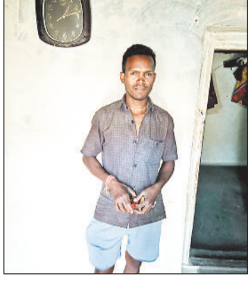
हरिभूमि न्यूज ►► रायगढ़