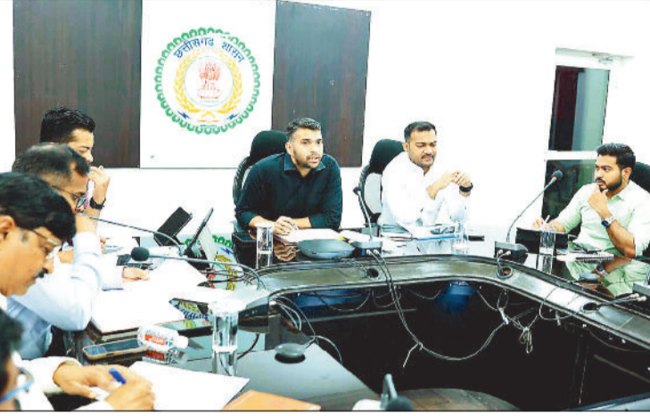
बैठक लेते कलेक्टर और उपस्थित अधिकारी।

बैठक में कलेक्टर ने वित्तीय वर्ष 2017-18 से 2025-26 तक स्वीकृत, पूर्ण, अपूर्ण एवं प्रगतिरत कार्यों की अद्यतन स्थिति की विस्तार पूर्वक जानकारी ली। उन्होंने निर्देशित किया कि पूर्ण हो चुके कार्यों के पूर्णता प्रमाण पत्र तीन दिवस के भीतर अनिवार्य रूप से प्रस्तुत किए जाएं, ताकि अभिलेखों का संधारण व्यवस्थित रूप से किया जा सके। कलेक्टर ने पोर्टल में लंबित प्रकरणों को शीघ्र निराकृत करने के लिए आवश्यक दस्तावेज एवं प्रमाण-पत्र समय पर अपलोड करने के निर्देश दिए। उन्होंने कहा कि सभी निर्माण एजेंसियां एवं संबंधित विभाग इस कार्य को प्राथमिकता