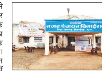
मामले ने पूरे क्षेत्र में सनसनी फैला दी है। स्थानीय प्रशासन के अधिकारी भी खुलकर कार्रवाई करने से बचते नजर आ रहे हैं। नागरिकों का आरोप है कि भ्रष्टाचार के खिलाफ आवाज उठाने वालों पर ही पुलिस कार्रवाई की जाती है। इससे आम जनता में भय और आक्रोश दोनों का माहौल बना हुआ है। एक ओर करोड़ों के भुगतान हो रहे हैं वहीं दूसरी ओर बिलासपुर में लोग पीने के पानी के लिए परेशान हैं। हालात यह हैं कि जलए विद्युत और सफाई विभाग के कर्मचारियों को मूल कार्यों से हटाकर अन्य कार्यों में लगाया जा रहा है जिससे मूलभूत सेवाएं प्रभावित हो रही हैं। सालों से अधूरा पड़ा गौरव पथ निर्माण अब प्रशासनिक उदासीनता का प्रतीक बन चुका है। इसी रास्ते से अधिकारी और जनप्रतिनिधि गुजरते हैं, लेकिन निर्माण कार्य की सुध लेने वाला कोई नहीं।

बिलासपुर। सारंगढ़ बिलासपुर संयुक्त जिला होने के बावजूद जहां सारंगढ़ में विकास की रफ्तार दिखाई देती है, वहीं बिलासपुर में हालात इसके बिल्कुल उलट नजर आ रहे हैं। स्थानीय लोगों का आरोप है कि बिलासपुर अब विकास नहीं बल्कि भ्रष्टाचार और अव्यवस्थाओं का केंद्र बन चुका है। कागजों में करोड़ों के विकास कार्य दर्ज हैं, लेकिन जमीनी हकीकत में उनका अस्तित्व तक दिखाई नहीं देता। नगर पंचायत बिलासपुर में पिछले एक वर्ष के दौरान कई योजनाओं में भारी अनियमितताओं के आरोप सामने आए हैं। इनमें प्रमुख रूप से अटल परिसर निर्माण, नाला सफाई एवं गहरीकरण, पेवर ब्लॉक और गार्डन निर्माण, ठेकेदारों को अग्रिम भुगतान, प्लेसमेंट टेका, बिना अनुमति शासकीय भूमि पर शांतिग कॉम्प्लेक्स निर्माण, गौरव पथ निर्माण और ट्रांसफार्मर.पोल शिफ्टिंग, अथुरे सीसी रोड का अग्रिम भुगतान इन सभी कार्यों में 10 प्रतिशत काम 100 प्रतिशत भुगतान जैसी गंभीर गड़बड़ियों के आरोप लगाए जा रहे हैं।