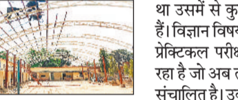
10वीं हाई स्कूल में 65 छात्र हैं और 12वीं हायर सेकेण्डरी में 71 छात्र सम्मिलित हैं। यहां के प्राचार्य श्रीमती ए.के.के.के. के मुताबिक परीक्षा के लिए जितने छात्रों का पंजीयन हुआ

पुसौर। पुसौर ब्लाक में ओपन स्कूल का परीक्षा केंद्र शासकीय हायर सेकेण्डरी स्कूल पुसौर को ही शासन द्वारा मान्यता प्रदान किया गया है। जिसमें प्रतिवर्ष इस परीक्षा में सैकड़ों की संख्या में आकर यहां परीक्षा लिखते रहे हैं लेकिन इस वर्ष इसके संख्या में काफी कमी आई है जिसकी संख्या मात्र 136 बताया जाता है। जानकारी के मुताबिक